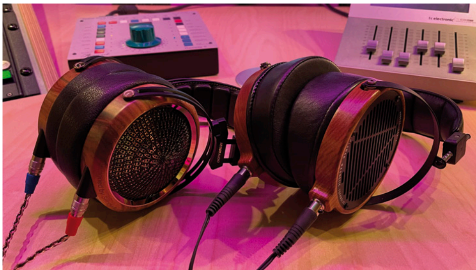
Gleiche Gewichtsklasse: Senty Audio Peacock und Studio-Hörbezug Audeze LCD-2

terschiedlich ausfällt. Aber bei aller äußerer Attraktivität zählen auch hier in erster Linie die inneren Werte. Die technologische Hauptattraktion ist dabei natürlich der planare magnetostatische Schallwandler. Wie immer braucht es für eine spezielle Konstruktion auch einen aussagekräftigen (oder werbewirksamen) Namen: Quad-Former-Technology. Die Planarmembran ist dabei in vier Zonen auf das Material aufgetragener Leiterbahnen aufgeteilt, zwei auf jeder Seite, so dass vier Antriebszonen entstehen. Das Membrangebilde bewegt sich in einem starken Magnetfeld und sitzt zwischen zwei Magnetanordnungen wie in einem Sandwich. Abgeschlossen wird der Schallwandler von zwei gelochten Abschlussplatten, einem CNC-gefrästen Trägergestell aus Flugzeugaluminium. Jede Lochreihe ist für eine gleichmäßige Verteilung des Schalls über den gesamten Frequenzbereich verantwortlich. Diese Konstruktion sorgt für eine homogene Energieverteilung und geringe Verzerrungen, die etwa durch Deformation der Membran entstehen können. Den Vorteil einer schnellen Transien-